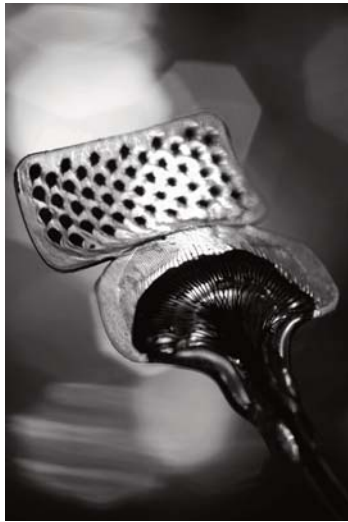
PUNKT 2010

Wer neue Entwicklungen originell und verständlich darstellt, schafft eine wichtige Voraussetzung dafür, dass Themen mit Technikbezug sachlich und unvoreingenommen diskutiert werden.