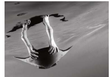
PUNKT 2008