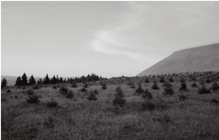
PUNKT 2011 (Fotostipendium) Thomas Imkamp