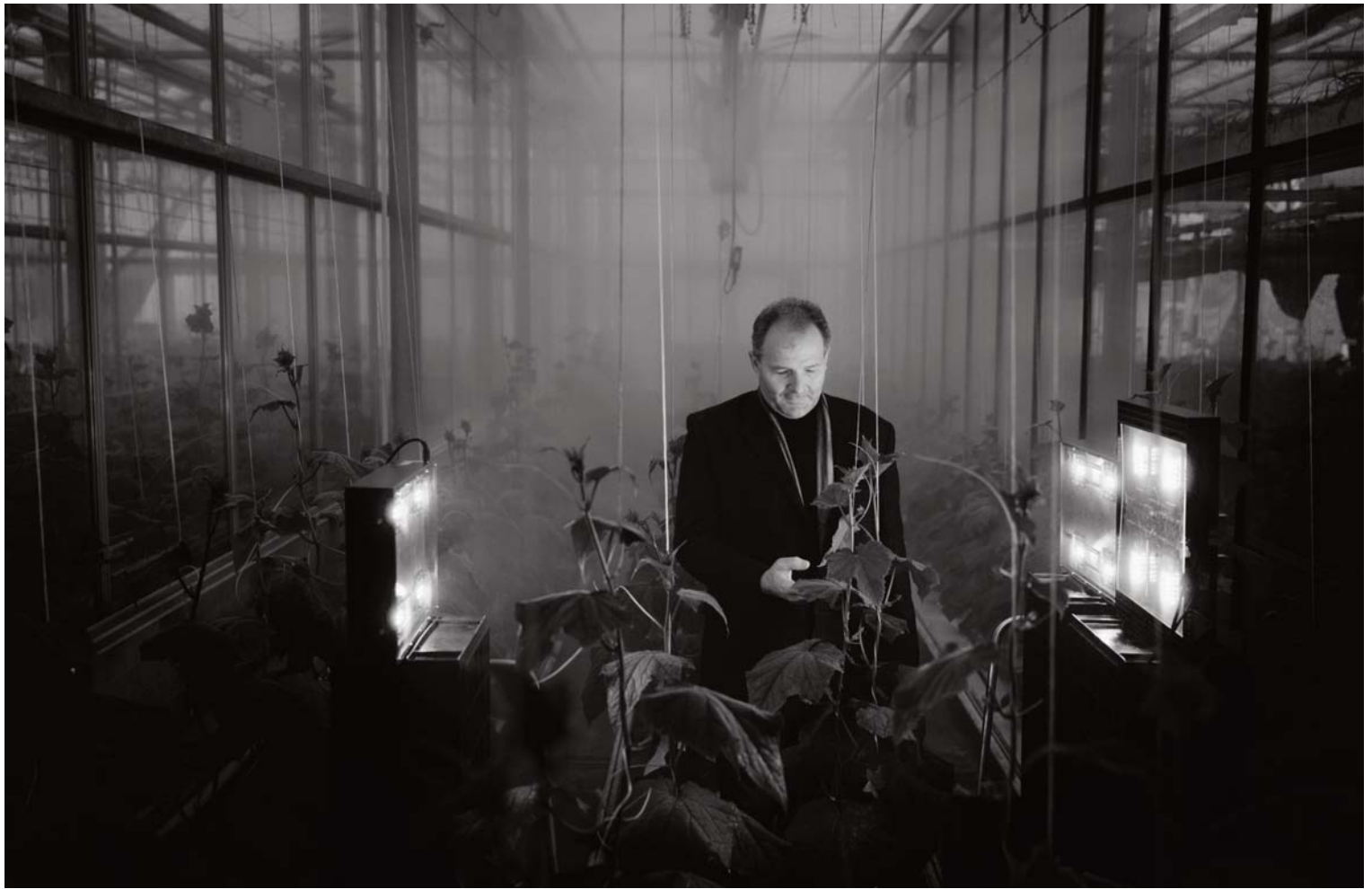
PUNKT 2013